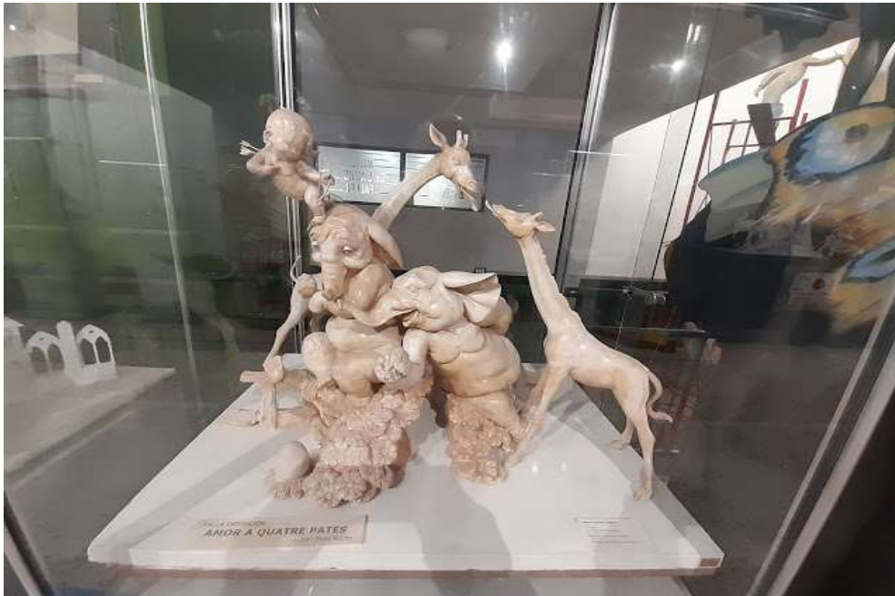
2005.- Amor a quatre pates.- Falla Exposición.- José Puche -2020.- Esteban Gonzalo.