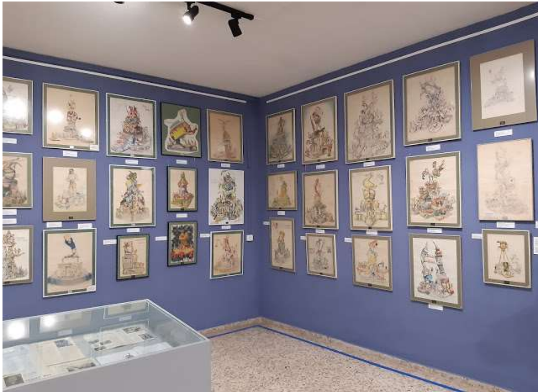
Bocetos.- 2020.- Esteban Gonzalo.