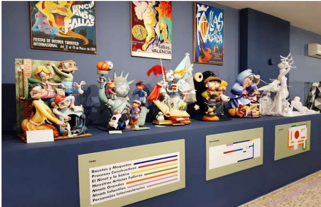
De fallas infantiles.- 2020.- Esteban Gonzalo

Ciudad temática, en el distrito de Benicalap, promovida por el citado Regino Mas, donde primero construyeron 50 naves para que los artistas falleros tuvieran un lugar digno donde trabajar, y después, viviendas asequibles, escuelas, iglesia, la sede y oficinas del Gremio, promotor y gestor del museo, y otros servicios. Y los nuevos vecinos ya plantaron fallas mayor e infantil en 1971.