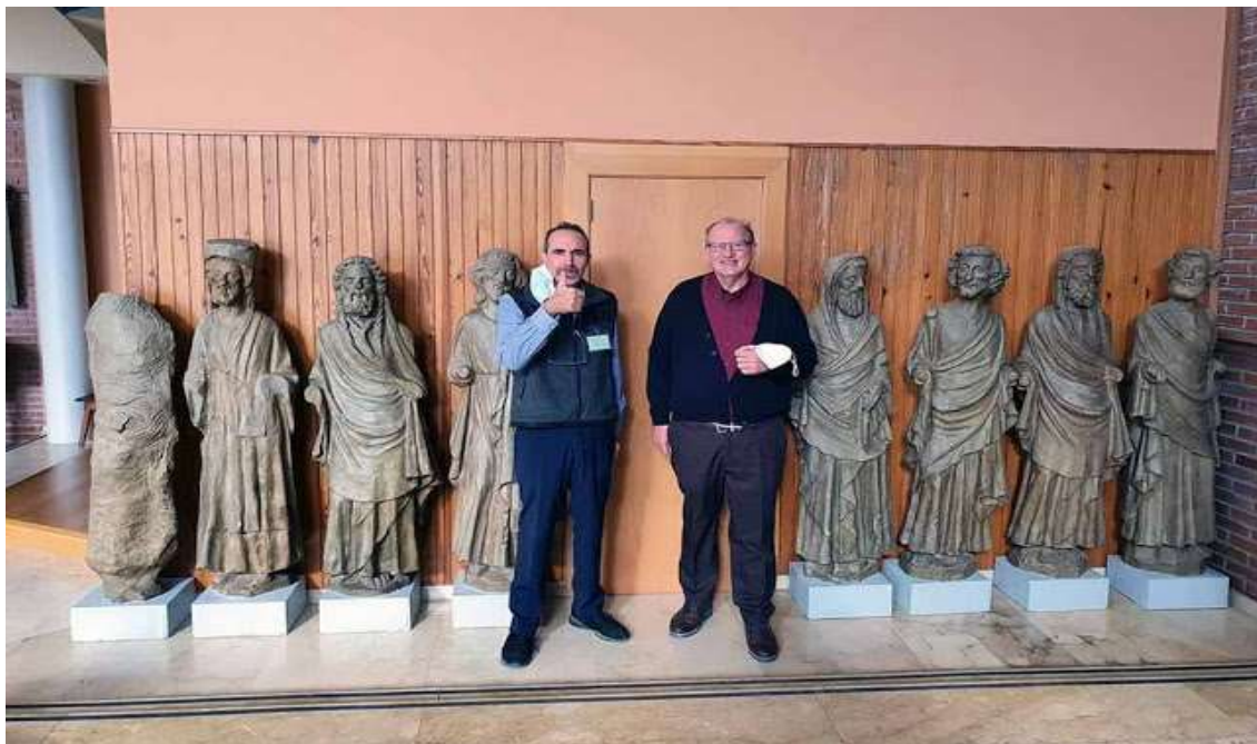
Los apóstoles en la iglesia San José Artesano.