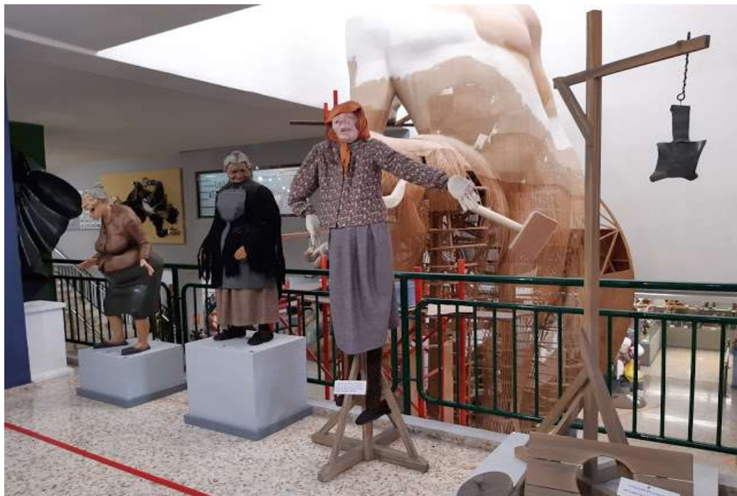
Del parot al cartón.- 2020.- Esteban Gonzalo

Ciudad temática, en el distrito de Benicalap, promovida por el citado Regino Mas, donde primero construyeron 50 naves para que los artistas falleros tuvieran un lugar digno donde trabajar, y después, viviendas asequibles, escuelas, iglesia, la sede y oficinas del Gremio, promotor y gestor del museo, y otros servicios. Y los nuevos vecinos ya plantaron fallas mayor e infantil en 1971.