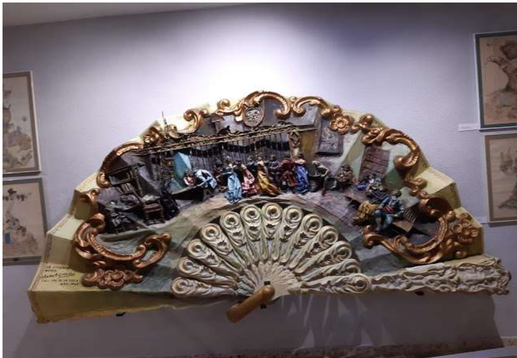
1948.- Palmito de boda.- Falla Pie de la Cruz.- Modesto González - 2020 Esteban Gonzalo