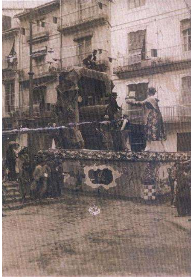
1928.- Falla plantada en el Tros-Alt.-Libro 150 Aniversario