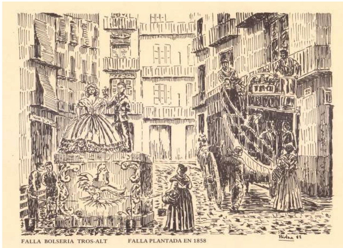
Dibujo falla 1858 y un ripert.-Libro 150 Aniversario.

En la plaza del Tossal o Tros-Alt, hasta 1981 oficialmente la prolongación de la calle Bolsería hasta las de Caballeros y Quart, fue plantada en 1858 su primera falla, de estilo tradicional y autor desconocido, pero con boceto y libret de Josep Bernat i Baldoví, quien también escribió los correspondientes a los años 1860 y 1861, para las tres fallas plantadas en ese lugar en el siglo XIX. Después hubieron fallas en 1916, 1921, 1934 y 1940, cuando comenzaron una continuidad que sólo fue interrumpida en 1941, 1943, 1948, 1949, 1951, 1954, 2020 y este año, inicialmente en su fecha tradicional de marzo.