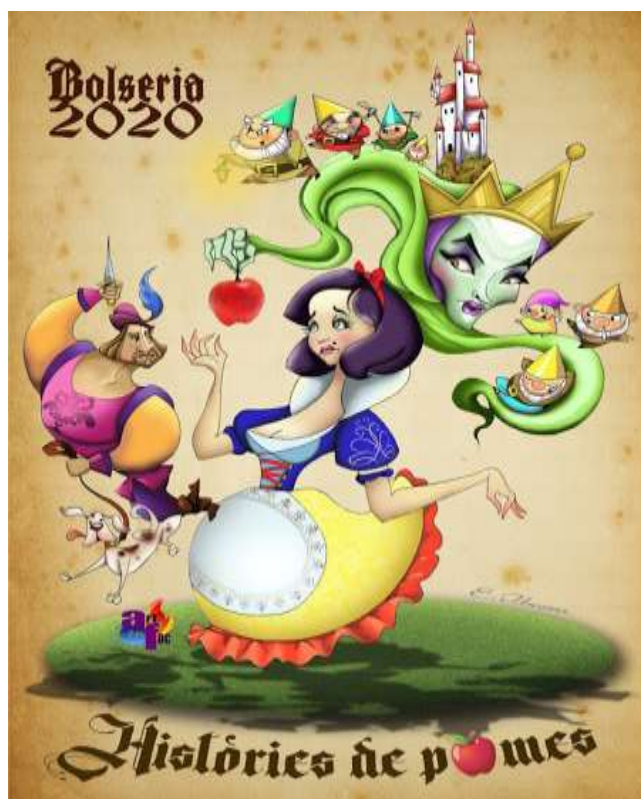
Boceto Falla grande 2020.