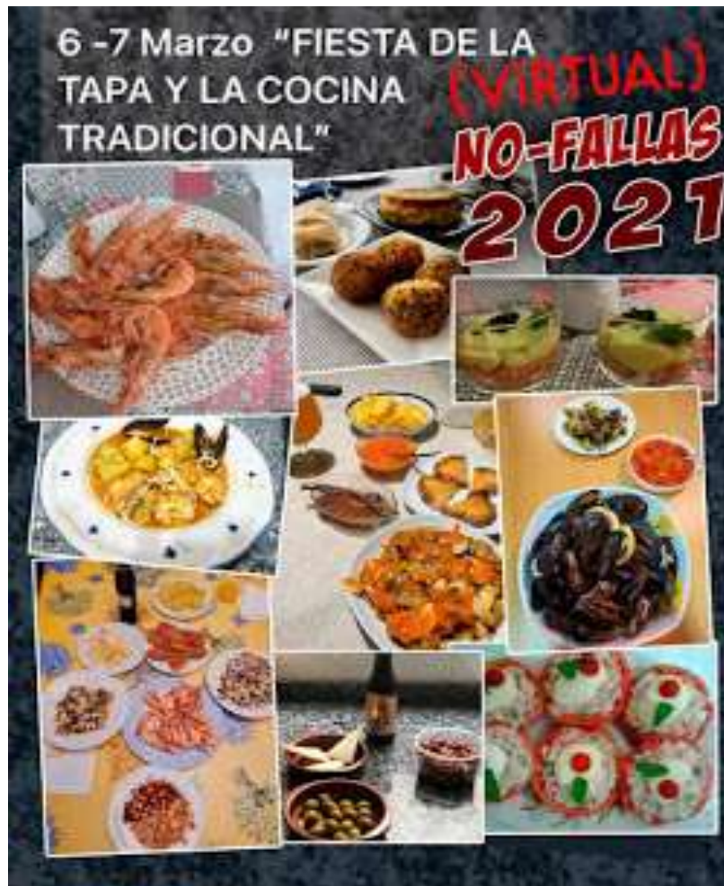
2021.- Cartel virtual "Fiesta de la tapa y la cocina tradicional"

Como la pandemia no permitió reanudar los festejos falleros en el resto del año pasado y tampoco en lo que llevamos del 2021, los medios de comunicación audiovisuales e impresos, están sacando de sus archivos para transmitir alegría a oyentes, televidentes y lectores. Por su parte, las comisiones falleras, demostrando su versatilidad de adaptación, han preparado actividades para difundirlas por las redes sociales. Bolsería Tros-Alt es una de ellas. Aunque en el último trimestre del año pasado efectuaron algunas actividades, con su Crida iniciaron el pasado 28 de febrero su "Programa de Festejos Culturales Virtuales Fallas 2021", para animarse y al unísono mantener su habitual cooperación falleros-vecindario.